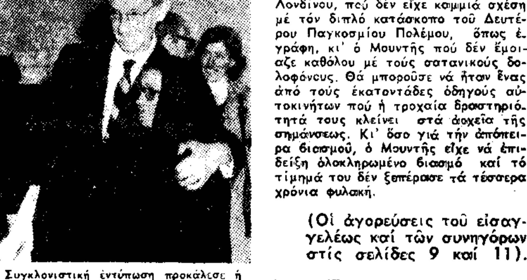
Συλλογική ἐπισημη προκήρυξη ἡ συμμαχία πού ἱδρύει ὁ πατέρας τῶν...